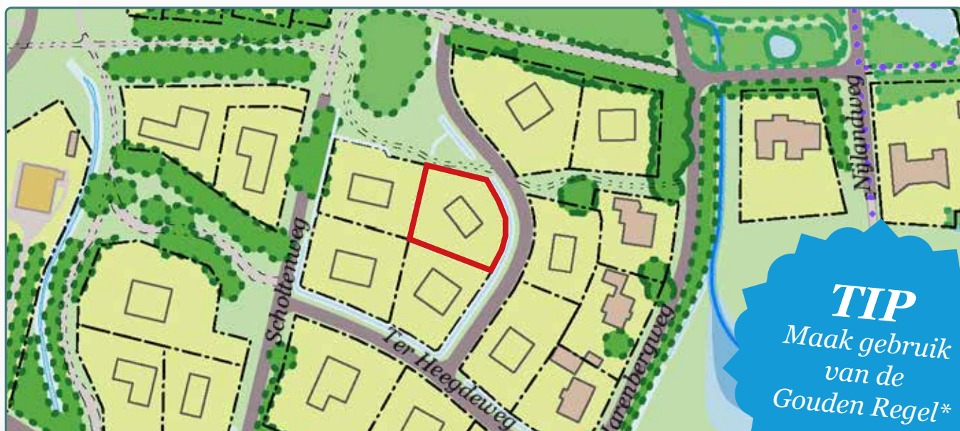
Situatietekening kavel 168