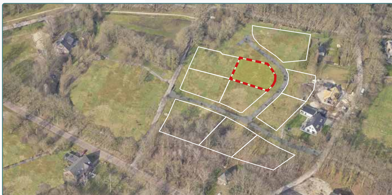
Kavel 168 vanuit de lucht